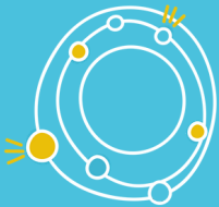
ESPACE DE COWORKING